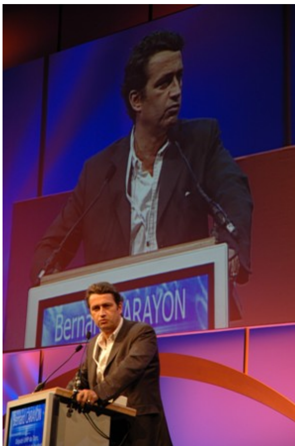
C. Photo Image Immédiate - Groupe Archange. Bernard Carayon - Député

En effet, l'Etat a-t-il pris la mesure de l'importance de l'Intelligence Economique qui dorénavant devrait être incluse dans la politique publique et devenir comme l'a affirmé Bernard Carayon « dessin du destin ». Cette politique devrait se décliner en plusieurs volets :