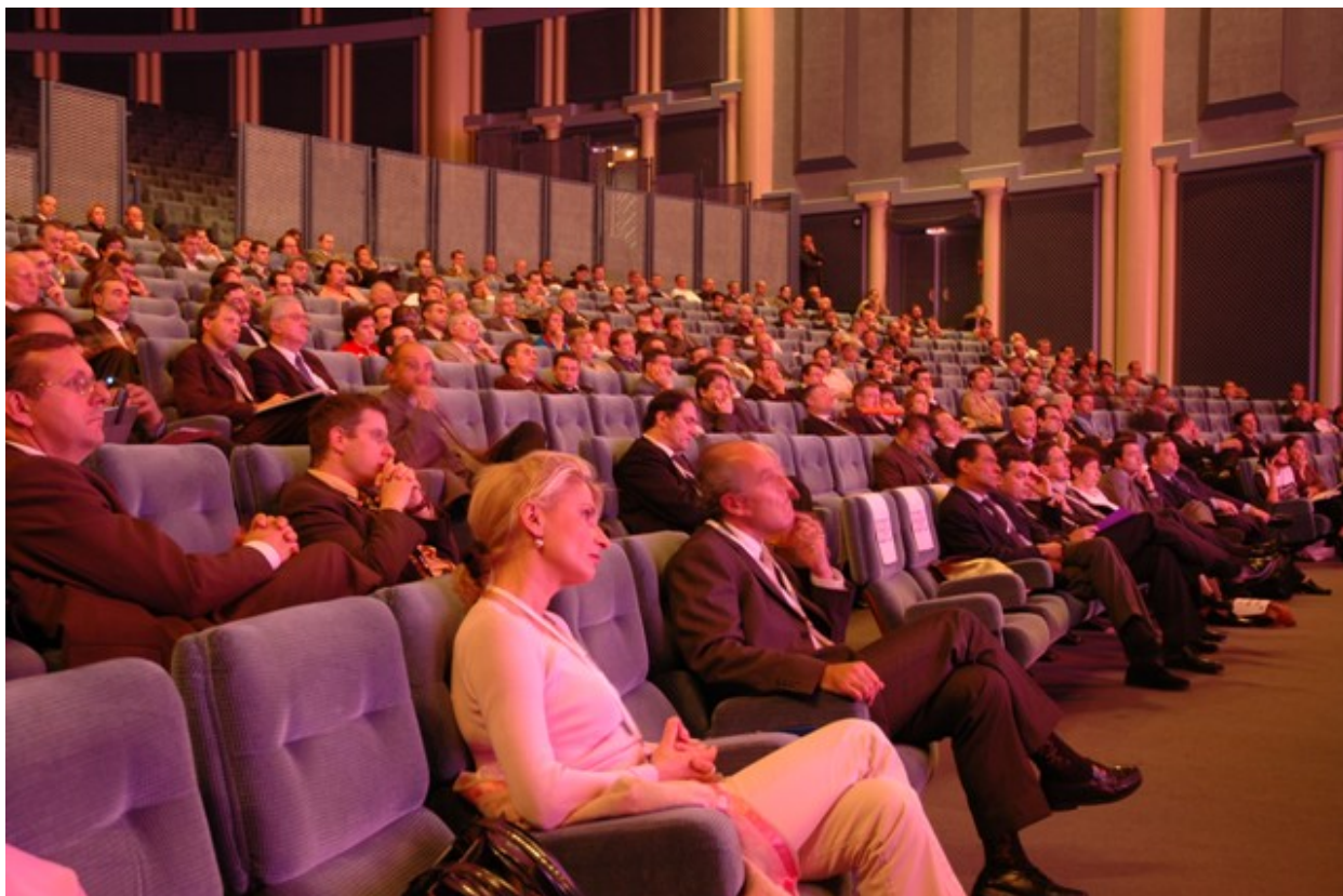
C.photo Image Immédiate - Groupe Archange

Un responsable de Lexmark : Dans mon entreprise, les dirigeants ne souhaitent pas que j'utilise des technologies françaises pour des questions de diffusion mondiale des produits français !